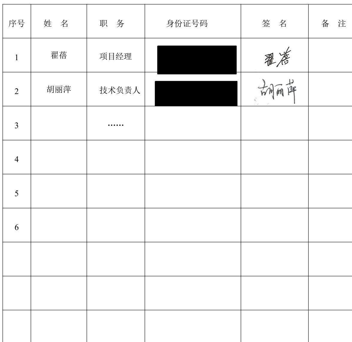
附件五：项目部主要管理人员签名备案表