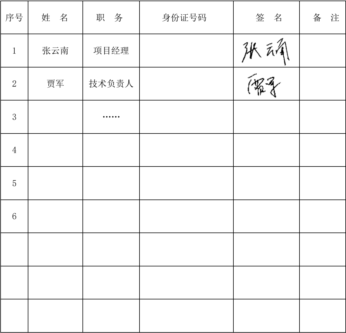
附件四：项目部主要管理人员签名备案表